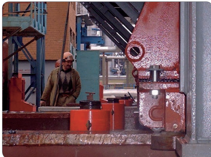
Cilindro ritorno a molla compatto da 100 ton corsa 50 mm con testina autolivellante.