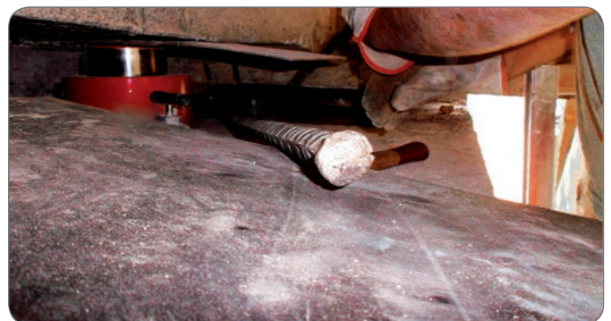
Cilindro ritorno a molla compatto da 100 ton con valvola regolatrice di flusso unidirezionale.