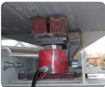
Cilindro compatto da 100 ton - modello CRM100/50C 100 ton 50 mm di corsa.