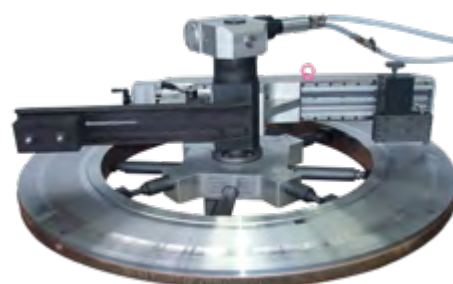
Esempio di applicazione