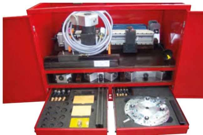
Contenitore per il trasporto di FD e degli accessori