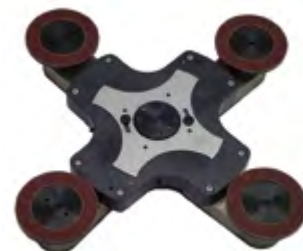
Disco portasatelliti di SHS 600