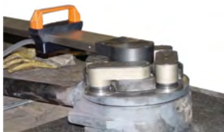
Smerigliatura di un cuneo di valvola a saracinesca