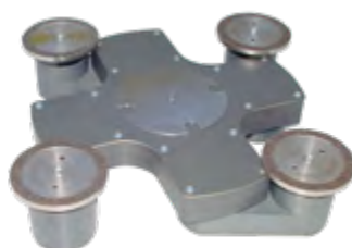
Disco portasatelliti di SHS 600