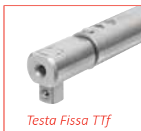
Testa Fissa TTf