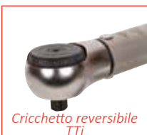
Cricchetto reversibile TTI