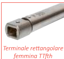
Terminale rettangolare femmina TTfth